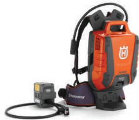
HUSQVARNA BLI950X 967 09 32-01