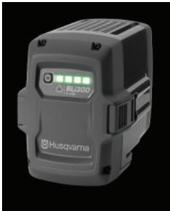
HUSQVARNA BATERÍA BLI300 967 07 19-01