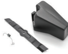
HUSQVARNA KIT BIOCLIP 597 41 37-01