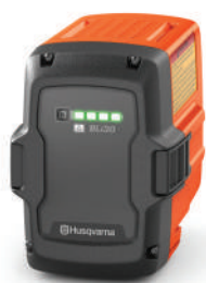
HUSQVARNA BATERÍA BLI30 967 93 77-01