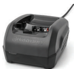
HUSQVARNA CARGADOR QC250 967 97 01-01