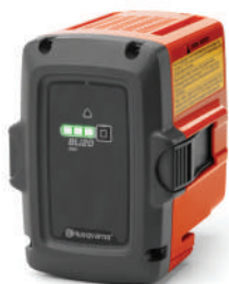
HUSQVARNA BATERÍA BLI20 967 09 17-01