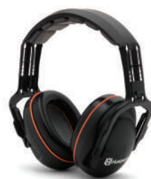
PROTECTOR AURICULAR 505 66 53-04