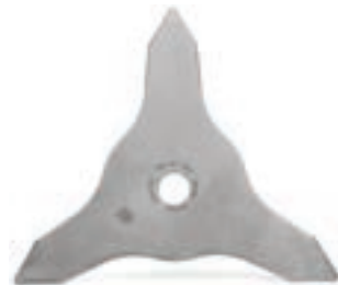
HOJA HIERBA 3-DIENTES 578 44 49-01