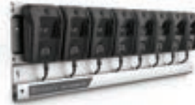
RAÍL DE CARGA CON CARGADORES 40-C80 970 62 19-01