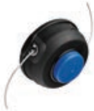
TRIMMY T25 578 44 61-01