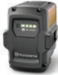
HUSQVARNA BATERÍA BLI200X 970 44 89-01