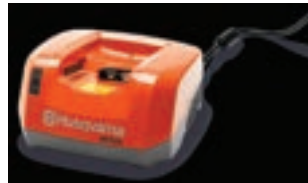
CARGADOR QC500 970 44 95-01