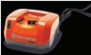
CARGADOR BATERÍA QC330 970 52 22-01