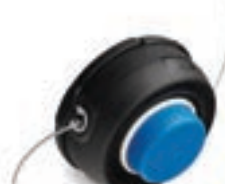
TRIMMY T35X 578 44 65-01