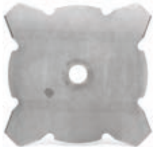
HOJA PARA HIERBA, 4 DIENTES 578 44 37-01