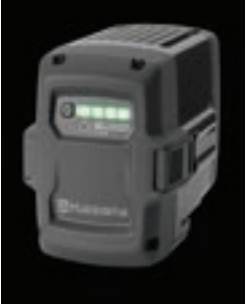
HUSQVARNA BATERÍA BLI300 967 07 19-01