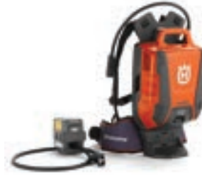
BATERÍA BLI950X 967 09 32-01