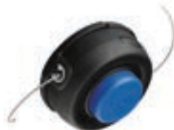
TRIMMY T35 578 44 63-01