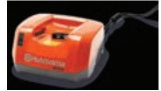
CARGADOR DE BATERÍA HUSQVARNA QC330 966 73 06-01