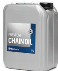
ACEITE DE CADENA MINERAL 579 39 61-01