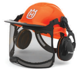
CASCO FORESTAL, FUNCTIONAL 576 41 24-02