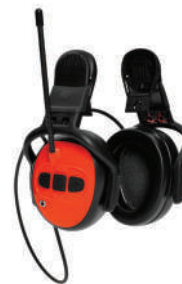
AURICULARES PARA CASCOS CON RADIO FM 578 27 49-04