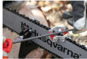
CORTE INTENSIVO 510 09 57-02