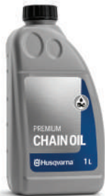
ACEITE DE CADENA MINERAL 579 39 60-01