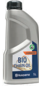
ACEITE CADENA HUSQVARNA X-GUARD BIO 596 45 73-01