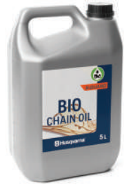
ACEITE CADENA HUSQVARNA X-GUARD BIO 596 45 73-02