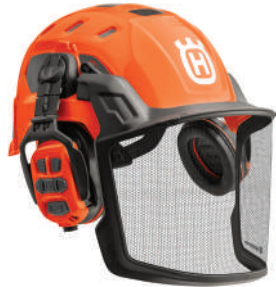
X-COM R TECHNICAL FOREST HELMET 595 08 43-01