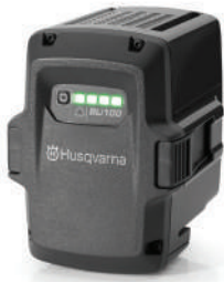
HUSQVARNA BATERÍA BL1100 967 09 18-01