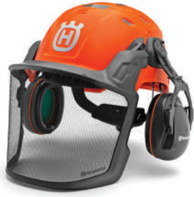
CASCO FORESTAL, TECHNICAL 585 05 84-01