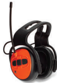
PROTECTOR AURICULAR CON RADIO FM 578 27 49-03