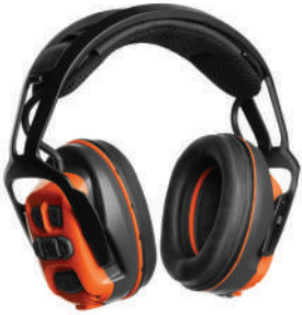
PROTECTORES AURICULARES X-COM R 595 08 40-01