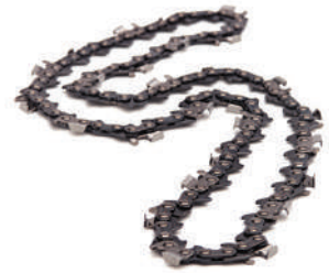
CADENA CORTADA H00 64 ESLABONES 501 84 40-64