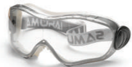
GAFAS DE PROTECCIÓN, GOGGLES 544 96 39-01