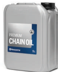
ACEITE DE CADENA MINERAL 579 39 61-01