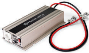
HUSQVARNA CONVERTOR DE TENSIÓN V1600F 967 62 85-01