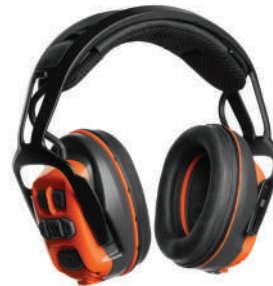
PROTECTORES AURICULARES X-COM R 595 08 40-01