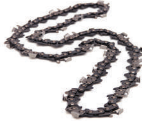
CADENA CORTADA HOO 64 ESLABONES 501 84 40-64