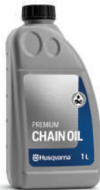
ACEITE DE CADENA MINERAL 579 39 60-01