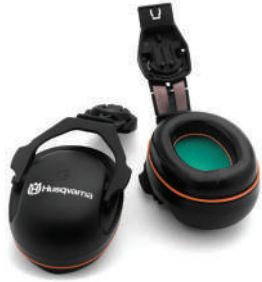
AURICULARES PARA CASCOS 505 66 53-25