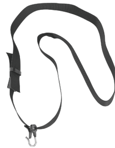
ARNÉS DIAGONAL 537 21 62-01