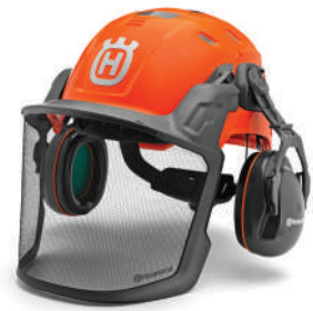
CASCO FORESTAL, TECHNICAL 585 05 84-01