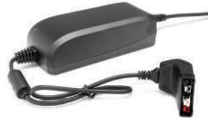
HUSQVARNA CARGADOR QC80 967 33 56-31