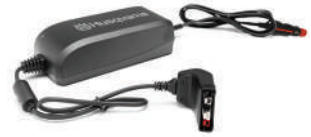
HUSQVARNA CARGADOR QC80F 967 62 83-01