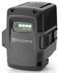
HUSQVARNA BATERÍA BL1100 967 09 18-01