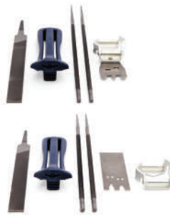
KITS DE AFILADO 580 68 75-01