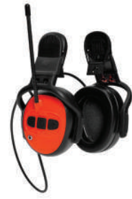
AURICULARES PARA CASCOS CON RADIO FM 578 27 49-04