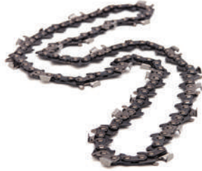
CADENA CORTADA HOO 58 ESLABONES 501 84 40-58