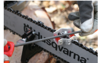
CORTE INTENSIVO 510 09 57-02