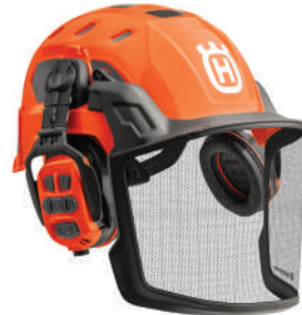
X-COM R TECHNICAL FOREST HELMET 595 08 43-01