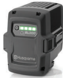
HUSQVARNA BATERÍA BL1300 967 07 19-01