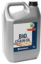
ACEITE CADENA HUSQVARNA X-GUARD BIO 596 45 73-02