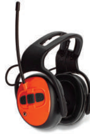
PROTECTOR AURICULAR CON RADIO FM 578 27 49-03