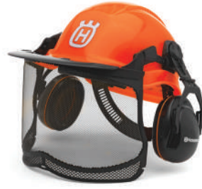
CASCO FORESTAL, FUNCTIONAL 576 41 24-02