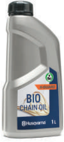
ACEITE CADENA HUSQVARNA X-GUARD BIO 596 45 73-01